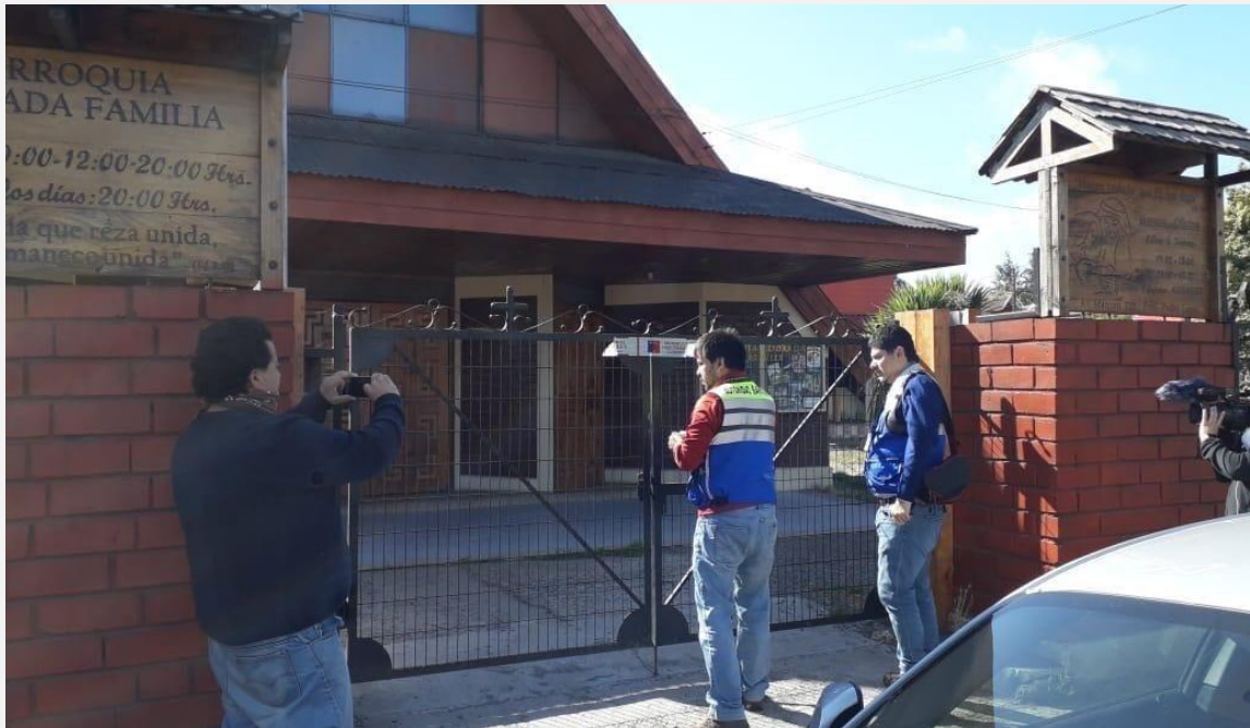
Fuente: “Mantener abiertas las iglesias en Chile”, ADF International .