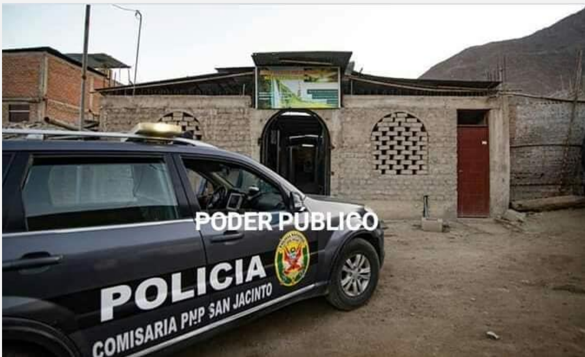
Fuente: “Pastor de iglesia pentecostés fue detenido por realizar culto incumpliendo el aislamiento social”, Chimbote Hace Noticia