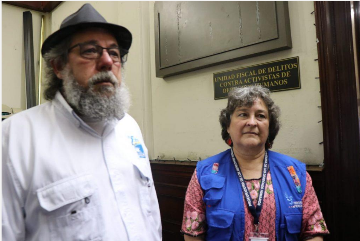
Fuente: "Director de la Casa del Migrante denuncia amenazas", El Periódico