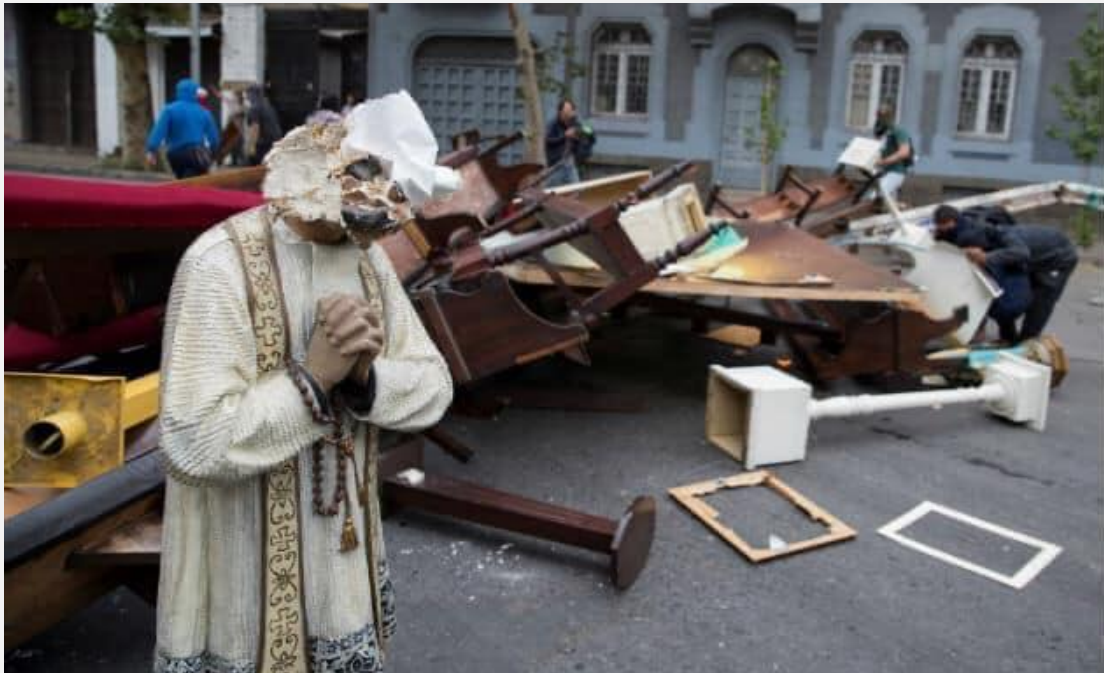
Fuente: "Chile. Insistimos: de revolución exclusivamente social, nada. Hay ataques, vandalismo y profanaciones contra las iglesias cristianas", Hispanidad