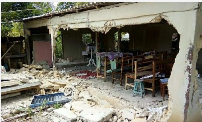
Fuente: “Demuelen templo Evangélico en Santiago de Cuba por ser «Construcción Ilegal »”, Acontecer cristiano