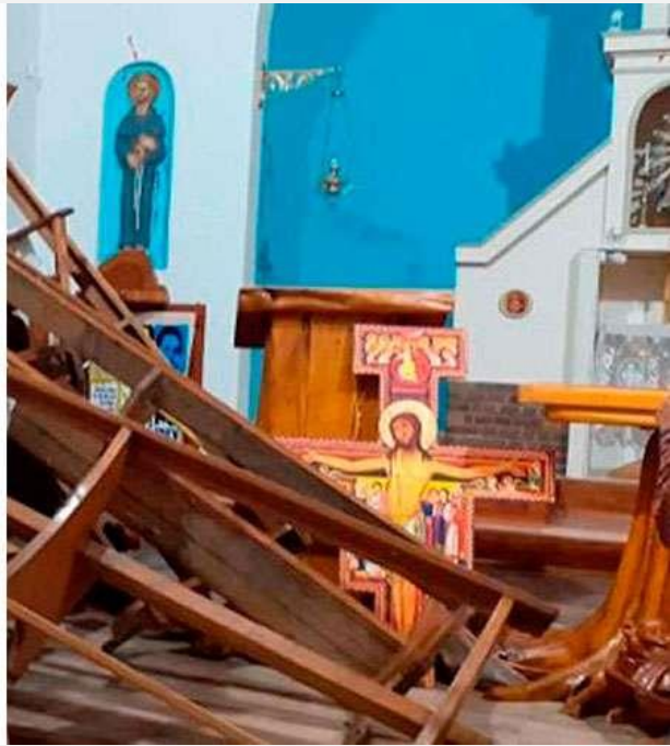
Fuente: “Dejan en libertad a tres imputados de atacar iglesia en Argentina”, Aciprensa