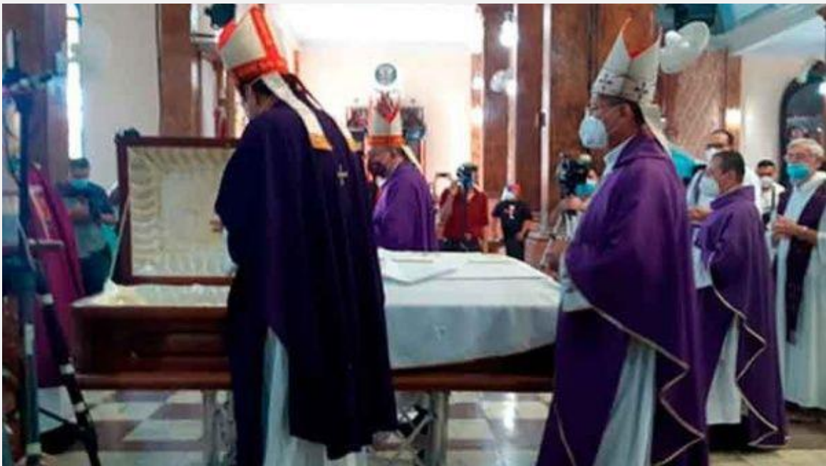
Fuente: “El Salvador: asesinan al rector del seminario Romero”, Vatican News