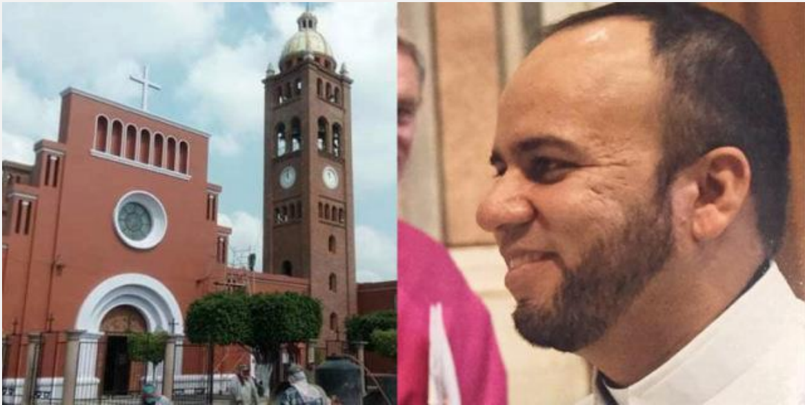
Fuente: “Apuñalan hasta en quince ocasiones al párroco del Refugio en Briseñas (Michoacán)” Aletheia

En el último semestre del año, los grupos criminales continúan destrozando y robando iglesias de culto, especialmente cristianos, como una forma más de ingresos económicos, aprovechando también la ausencia de asistentes debido a la pandemia. Asimismo, las iglesias y, en su mayoría, líderes religiosos cristianos continúan siendo objeto de extorsión, secuestro y amenazas de muerte. En muchos casos, estos incidentes conducen a la cancelación de actividades de culto, a veces incluso actividades en línea, con el fin de proteger la integridad de las pocas personas autorizadas a asistir y transmitir el servicio religioso.