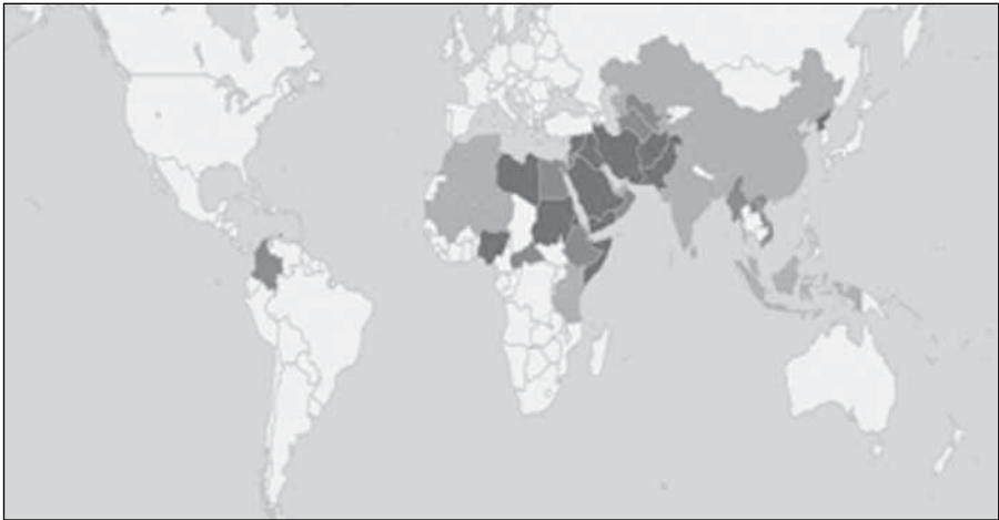
Illustration 1: Länder auf dem Weltverfolgungsindex 2014. 11

Illustration 2 ist Teil einer Tabelle der christlichen Hilfsorganisation Open Doors International, die mit den Daten aus dem Weltverfolgungsindex zur Christenverfolgung weltweit, erstellt wurde.